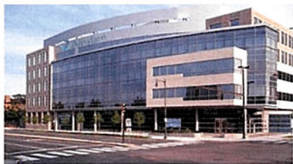
Alynlyam-Hauptquartier in Cambridge bei Boston, USA

und führte nach der Fusion mit Ribopharma AG eine weitere Finanzierungsrunde über etwa 24 Mio. US$ durch. Ein Jahr nach der letzten Finanzierungsrunde erfolgte im Mai 2004 die Börseneinführung in der USA.